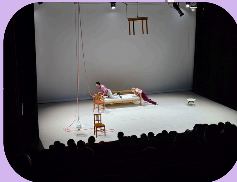
De Stilte - Voor de draad ermee