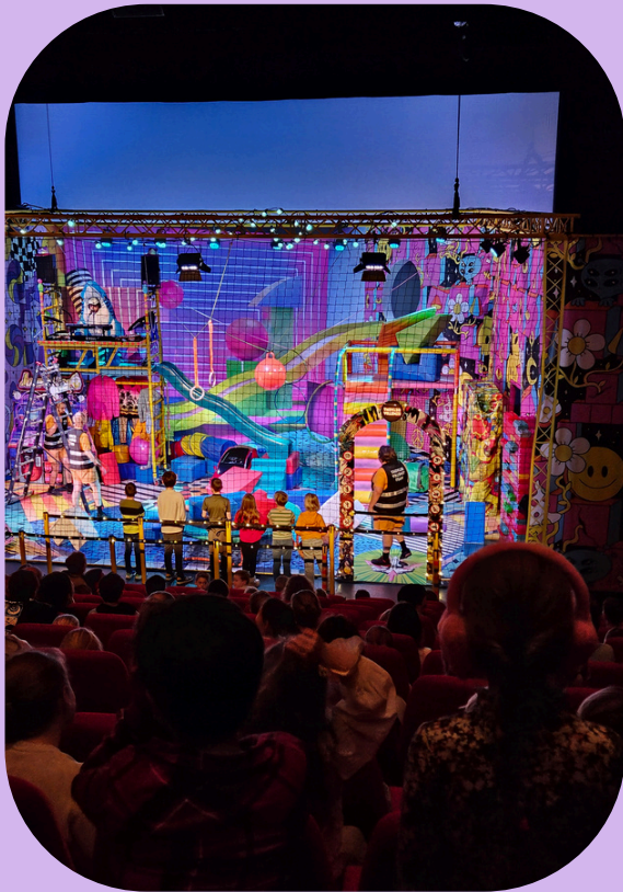
Artemis - Slakken hebben ook weleens haast

In Goirle en Riel maken scholen al jaren gebruik van de diensten van Brabant menu: een organisatie die theatervoorstellingen organiseert voor de kleine gemeentes. Voor elke doelgroep maken zij verschillende voorstellingen en elke podiumkunst discipline is vertegenwoordigd: dans, theater en muziek. Er zijn voorstellingen voor op school, maar veel vinden in Jan van Besouw plaats. De cultuuraanjager en de intermediair trekken hierin samen in de afstemming en in de uitvoering.